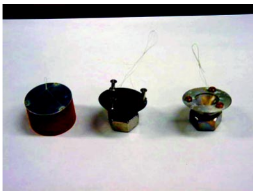
Fig.2 受圧板写真 ゴム製平面型(B)(左), ゴム製円錐型(C)(中), アルミ製円錐型(A)(右)